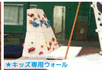
★キッズ専用ウォール

綱渡りとトランポリンの間のスポーツです。黒板ウォールの幅が 2 倍 (5.4m) に！見た目は簡単そうなのにコレが意外と…？ 迫力満点の壁は目立つこと間違いなし！