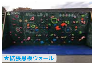
★拡張黒板ウォール