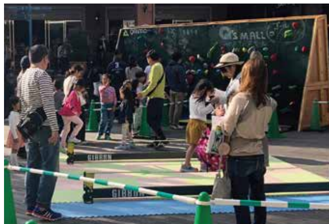
[展開: 黒板ウォール+オブション (拡張ウォール+スラックライン)]

商業施設の一等地にボルダリングウォールとスラックラインを展開! ショッピングにいらっしゃったお子様連れのご家族でこちらも終日賑わいました! 複数のアトラクションはお客様の滞在時間を長くします☆